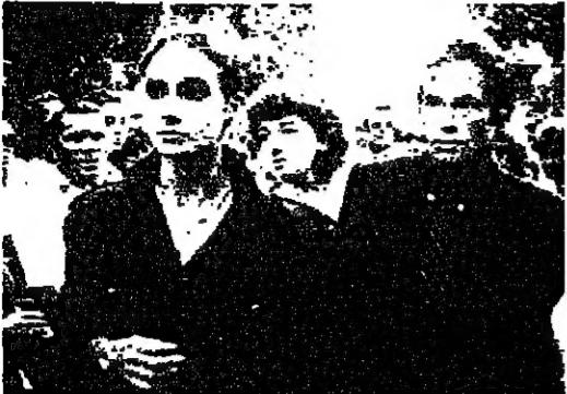
بالومو ليليرس مصارع الثيران الشهير وزوجته في تشجيع بيكيري